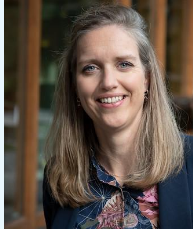
W. Vogels